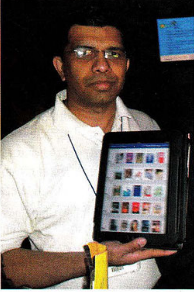
बुकगंगाचे मंदार जोगळेकर: भारतातही तांत्रिक क्रांती येत्या काही वर्षांत घडून येईल आणि ई-बुक रीडर्स सर्वांच्या हातात दिसायला हरकत नाही.

पुस्तकं उपलब्ध करून सुरुवात केली. आता मात्र किंडलच्या अत्याधुनिक आवृत्त्यांमध्ये नॉन इलेक्ट्रॉनिक डिस्प्लेमुळे पुस्तकं-गाणी-फोटोज-सिनेमे यासाठी ऑल-इन-वन सोल्यूशन उपलब्ध आहे. बाकी साधारणपणे सर्वच रीडर्समध्ये अक्षरांचा आकार लहान-मोठा करणं, पुस्तकं कधी उभी तर कधी आडव्या स्वरूपात वाचणं, हे पर्याय आहेत.